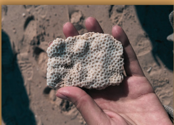
שלד של אלמוג

הספוג הוא בעל חיים לחתך שיהיה לא נראה כך