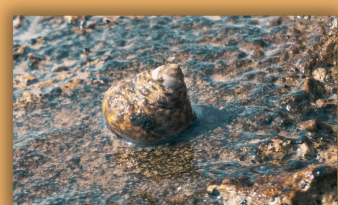
חילזון חד-שן משובץ