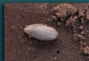
שלד של דיונון